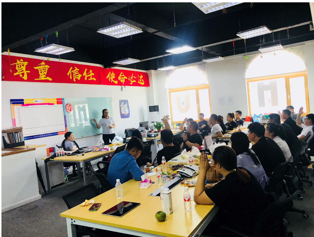
於報告期間內為職員組織的安全培訓課程